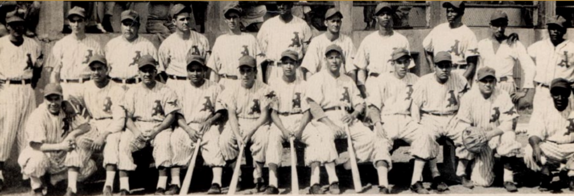
--JUGADORES DEL CLUB AGUILA DE VERACRUZ.--